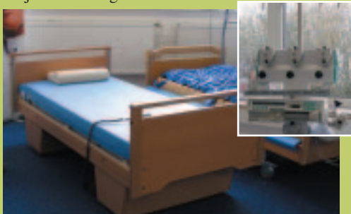
Pflegebetten für Altersheime - hergestellt von MediTech

Bei MediTech können Sie jederzeit eine ausführliche Beratung erhalten und eine Probefahrt unter Telefon 089/470 877 18 vereinbaren. Auch der Verleih von Rollstühlen oder Elektrofahrzeugen ist jederzeit möglich.