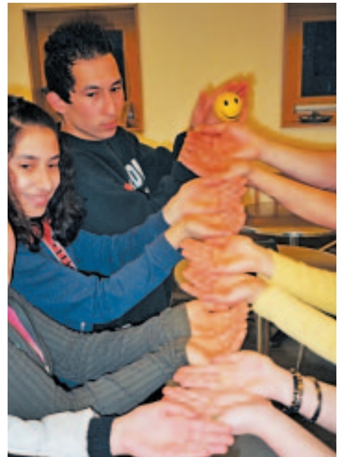
Beim Klassensprechertag arbeiten alle „Hand in Hand“ – ein Beispiel mit Symbolkraft, das Schule machen darf

richtungen in der Gemeinde berichtet. „Da wurde viel getan und nicht herumgeredet. Interaktion untereinander anstelle von Aktionismus ist angesagt.“