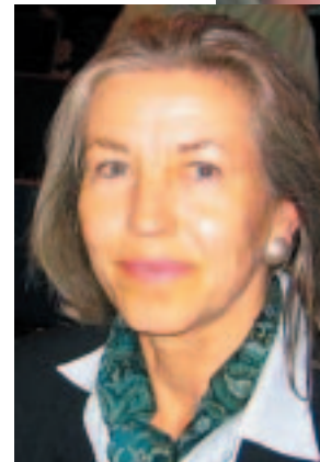
Dorothee von Walter Erziehungs- beratungsstelle © 089/31923 00