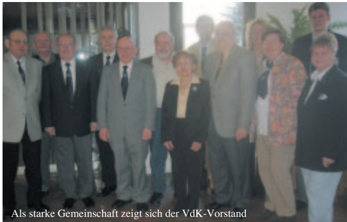
Als starke Gemeinschaft zeigt sich der VdK-Vorstand