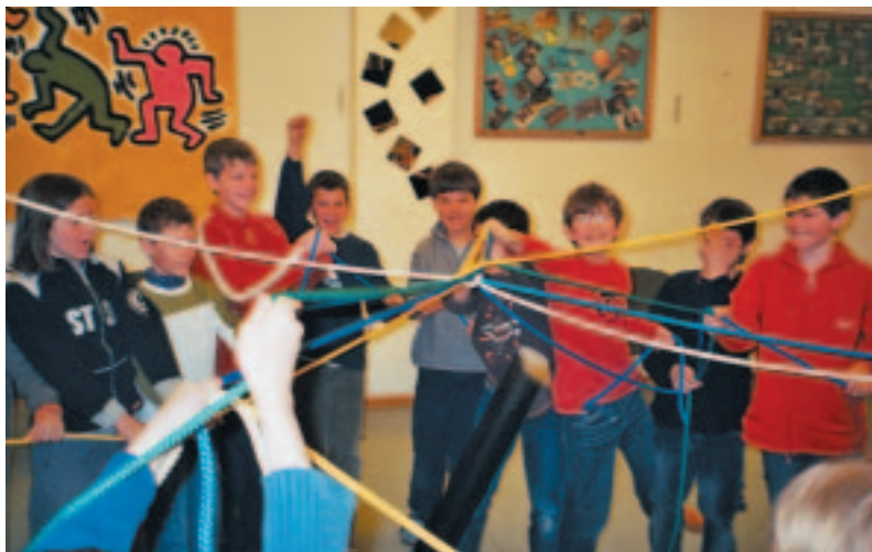
So sieht es aus, wenn bei Interaktionsspielen in der Schule „alle an einem Strang ziehen“

Ein weiter wichtiger Baustein im Gesamtkonzept ist das Programm „ KLASSE 2000 “, das sich bereits seit 1991/92 im Bereich Gesundheitsförderung und Suchtvorbeugung in der Grundschule bewährt hat – und „Fit für's Leben“ machen soll. Partner von „ KLASSE 2000 “, die durch einzelne