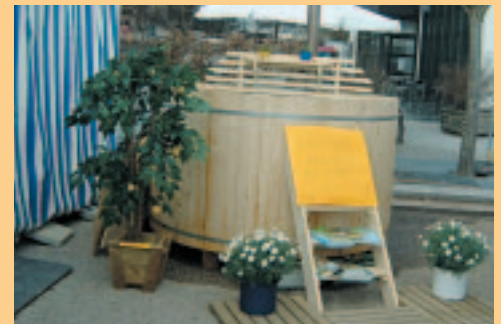
Badetup mit Edelstahlrofen zur Holzbefuerung: Den Tup man kaufen oder auch mieten (Geburtstage, Firmenfeiern, etc...)