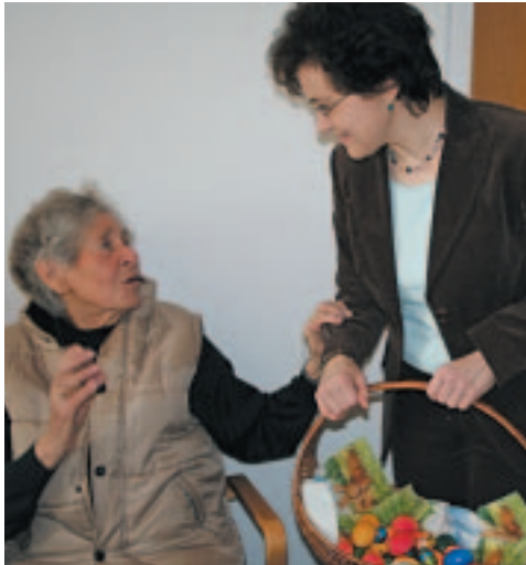
Osterbesuch im ASZ