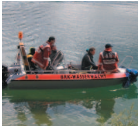
Ausbringen der Taucher mit dem WW-Motorrettungsboot zu einer der acht Tauchzonen.

PC-Soforthilfe vor Ort Installation und Reparatur von Soft- und Hardware 1/4 Std. nur 8,- € Tel. 01 79/966 9998