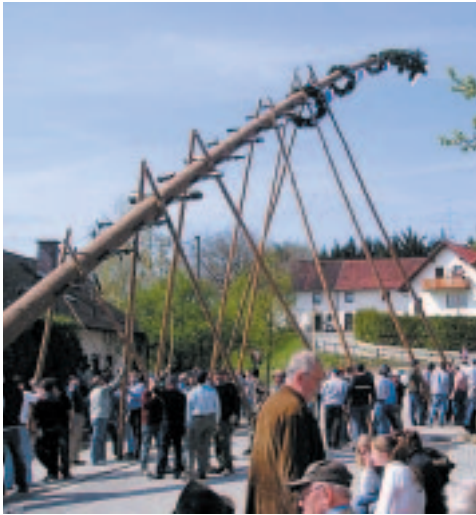
Hau Ruck heute und vor fast 40 Jahren beim Maibaumaufstellen in Günzenhausen

der auch die anderen Symbole am Maibaum erneuert hat, möchte nun jährlich ein Emblem restaurieren. Bei Spiegelei und frischen Getränken wurde lange gefeiert.