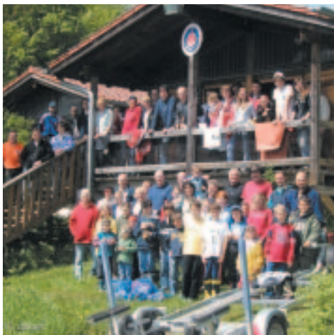
Alle Helferinnen und Helfer von Wasserwacht, abc-Divers und Tauch-Club Eching nach erfolgreicher Seerettung an der WW-Wachstation.

Malerbetrieb und Gerüstbau GmbH Hauptstraße 24 · 85376 Hetzenhausen Tel. 0 81 65/ 9 83 14 · Fax 0 81 65/ 9 83 16 Kassner@tux.friedhelm-kassner.de Internet: www.friedhelm-kassner.de