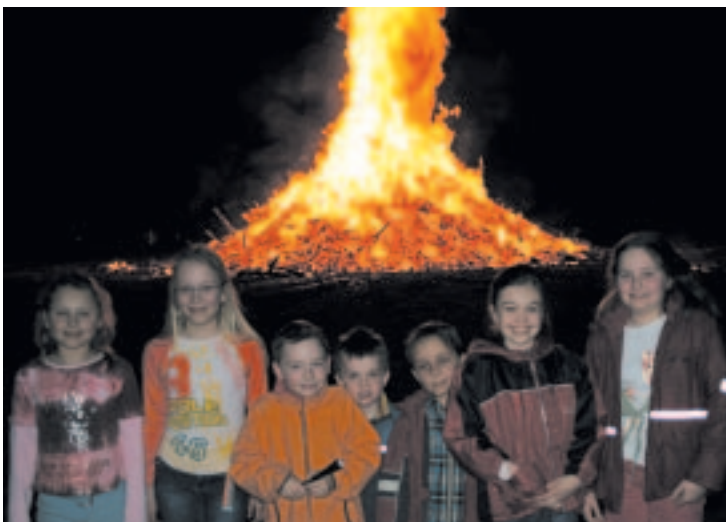
Mit einem mächtigen Osterfeuer wurde nach alter Väter Sitte in der Osternacht vom 15. auf den 16. April zünftig der Winter ausgetrieben

Der Echinger Burschenverein ist Veranstalter dieses traditionellen „Ostermo brenna“. Auch heuer kamen sicher wieder gute 200 Kubikmeter Brennholz zusammen, das auf dem freien Feld vor der Blauen Brücke an der Garching Straße kunstvoll zu einem riesigen Scheiterhaufen aufgeschichtet wurde. An dessen Spitze thronte auf einem ausrangierten Hochsitz der „Ostermo“, eine bekleidete Strohfigur, die den personifizierten Winter symbolisiert. „Viel Holz“ wird da manch einer voller Staunen gedacht haben. Zahlreiche Firmen spenden bereitwillig und palettenweise Bauholz und eine Menge Baumschnitt fällt um diese Jahreszeit auch immer an. Dessen Abtransport seitens des Burschenvereins wird natürlich gerne in Anspruch genommen. Auch die hölzernen Aufbauten am Faschingswagen des Burschenvereins finden hier jedes Jahr ihren finalen Verwendungszweck – und gehen bei diesem natürlichen Recycling in Flammen auf. In der Abenddämmerung gegen acht Uhr wurde der riesige Holzstoß mittels Fackeln in Brand gesetzt.