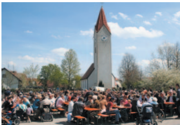
Beim gelungenen, sonnigen Maifest des Echinger Burschenvereins zeigte der Bürgerhausplatz wieder seine Qualitäten als Bürgerplatz

Das knisternde und knackende Feuer strahlt ordentlich Hitze ab und faszinierte die Besucher, darunter viele Familien mit Kindern.