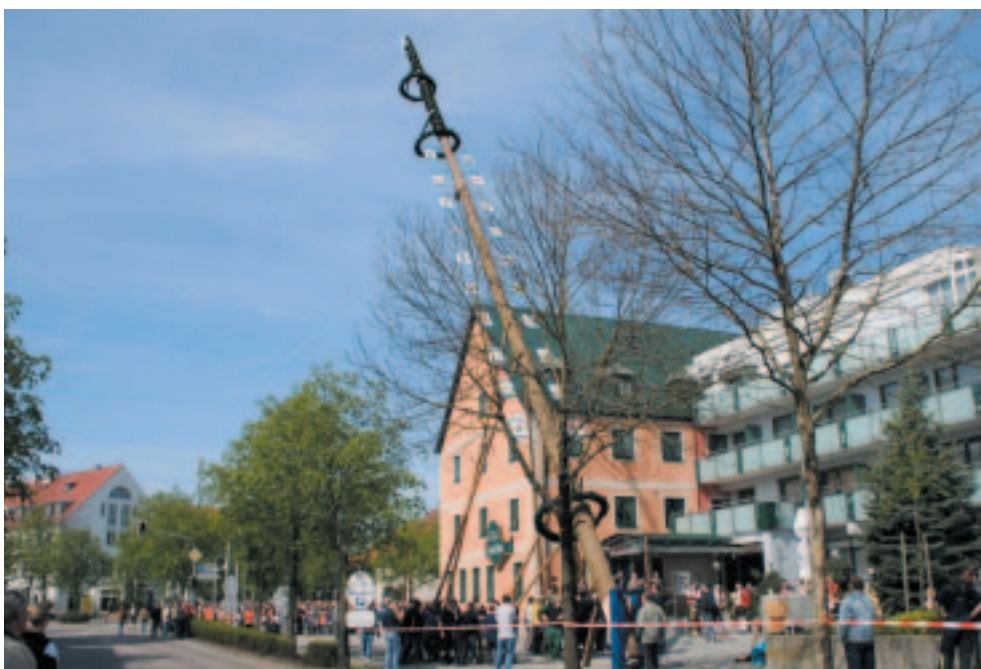
Maibaum 2006 – seit 60 Jahren ziert ein stattlicher Maibaum das Echinger Ortszentrum