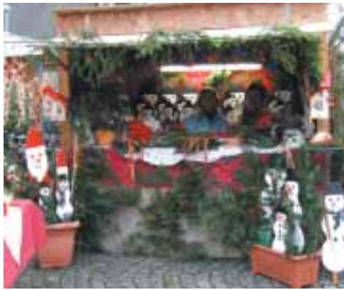
Eine schöne Auswahl handgefertigter Weihnachtsartikel wurde an den adventlich geschmückten Ständen feilgeboten