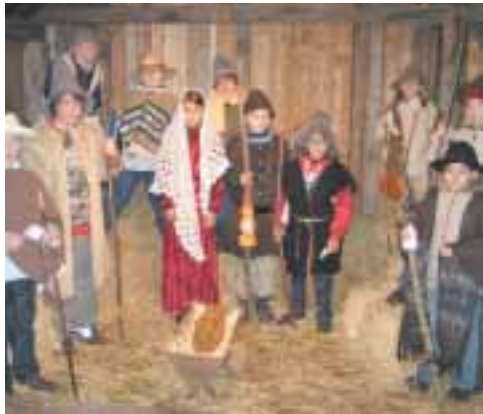
Die lebende Krippe, in der bereits Ochs, Esel und Schafe warteten, füllte sich bei Einbruch der Dunkelheit mit Maria und Josef, dem Jesuskind sowie den Hirten. Die Ministranten, sowie die (zukünftigen) Kommunionkinder Dietersheims übernahmen dies und lasen hierzu die Weihnachtsgeschichte vor.