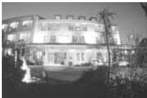
Das Hotel Olymp an der Wielandstraße