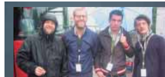
perfekte Bühnenshow von „Deichkind“