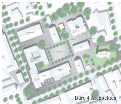
Büro 4 Architekten