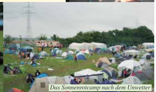
Das Sonnenrotcamp nach dem Unwetter