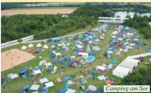
Camping am See