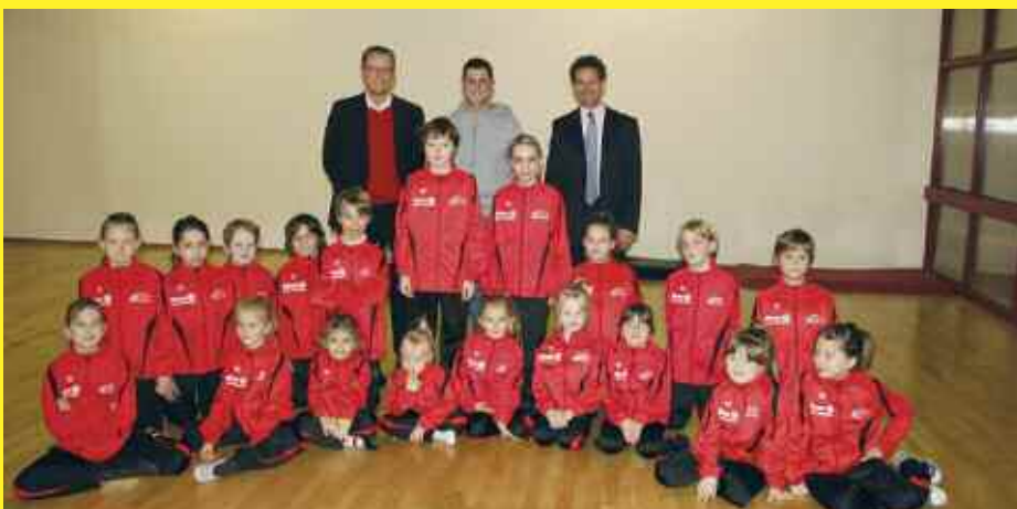
Die Kindergarde und das Kinderprinzenpaar der Narrhalla Heidechia e.V. wurden für die Saison 2011 mit neuen Trainingsanzügen ausgestattet. Diese wurden von der ALLIANZ-Agentur Stefani & Winkhofer, Neufahrn und der Firma Bock Dachtechnik GmbH, Freising gesponsert. Wir möchten uns ganz herzlich für die Trainingsanzüge bedanken. (Text+ Bild: Sabine Kussauer)