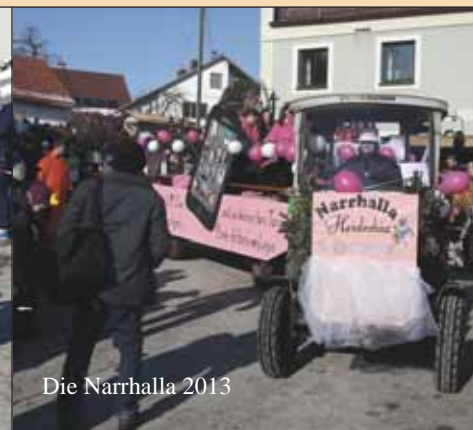
Die Narhalla 2013