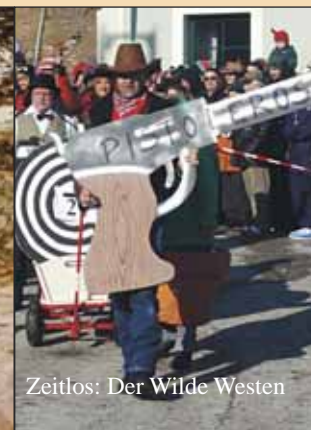
Zeitlos: Der Wilde Westen