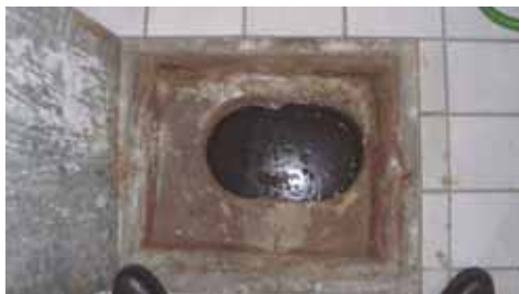
Typische Kellerbodenöffnung in den Häusern des Dichterviertels, damit man immer den aktuellen Grundwasserstand für das eigene Haus kontrollieren kann.

Liebe grundhochwassergeschädigte und nicht vom Grundhochwasser betroffenen Bürger Echings, die größte Niederschlagsmenge fiel am 5. Januar: 20 Itr. Der Grundwasser-Höchststand war am 31. Januar, der Grundwasser-Tiefststand am 4. Januar.