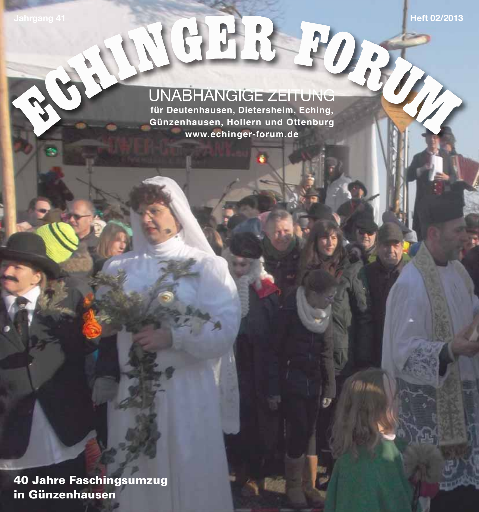
40 Jahre Faschingsumzug in Günzenhausen

UNABHÄNGIGE ZEITUNG für Deutenhausen, Dietersheim, Eching, Günzenhausen, Hollern und Ottenburg www.echinger-forum.de