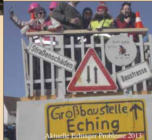
Aktuelle Echinger Probleme 2013