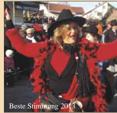
Beste Stimmung 2013