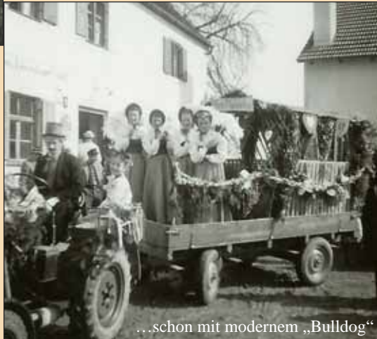
...schon mit modernem „Bulldog“