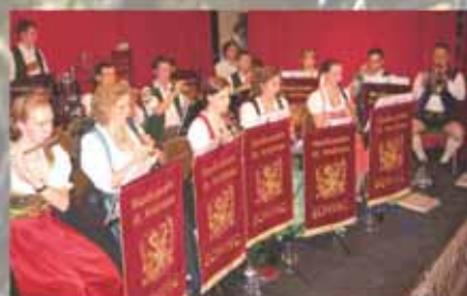
Starkbierfest des Musikvereins St.Andreas