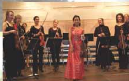
Kammerkonzert in der Musikschule