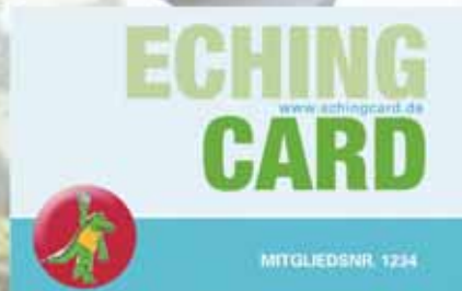
Sparen und sponsern: die Eching Card