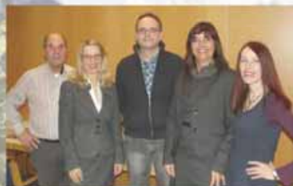
Neuer Vorstand beim ECHINGER FORUM

UNABHÄNGIGE ZEITUNG für Deutenhausen, Dietersheim, Eching, Günzenhausen, Hollern und Ottenburg www.echinger-forum.de