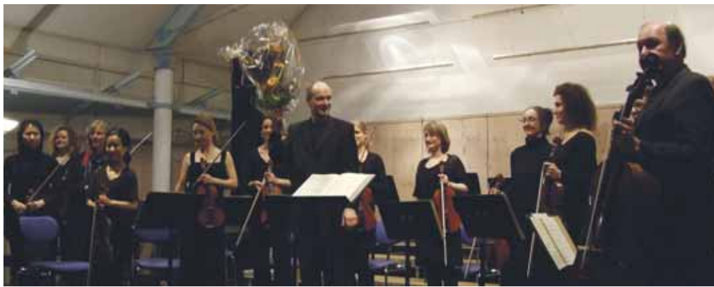
Das Kammerorchester Eching