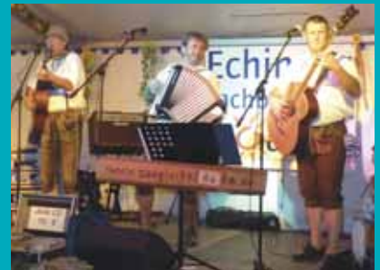
Sauglocknläutn spielen auf