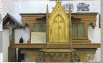
Neuer 'Herrgottswinkel' in der Bäuerlichen Sammlung