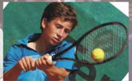
Bayerns größtes Tennisturnier beim SCE