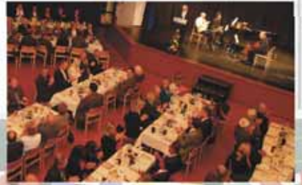
Hereinspaziert ins neue Bürgerhaus! Ich freu