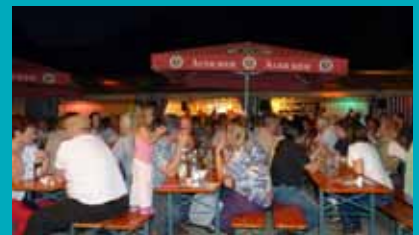
Abendstimmung beim Kartoffelfest