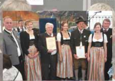
Weinbergsschützen feierten 50 Jahre