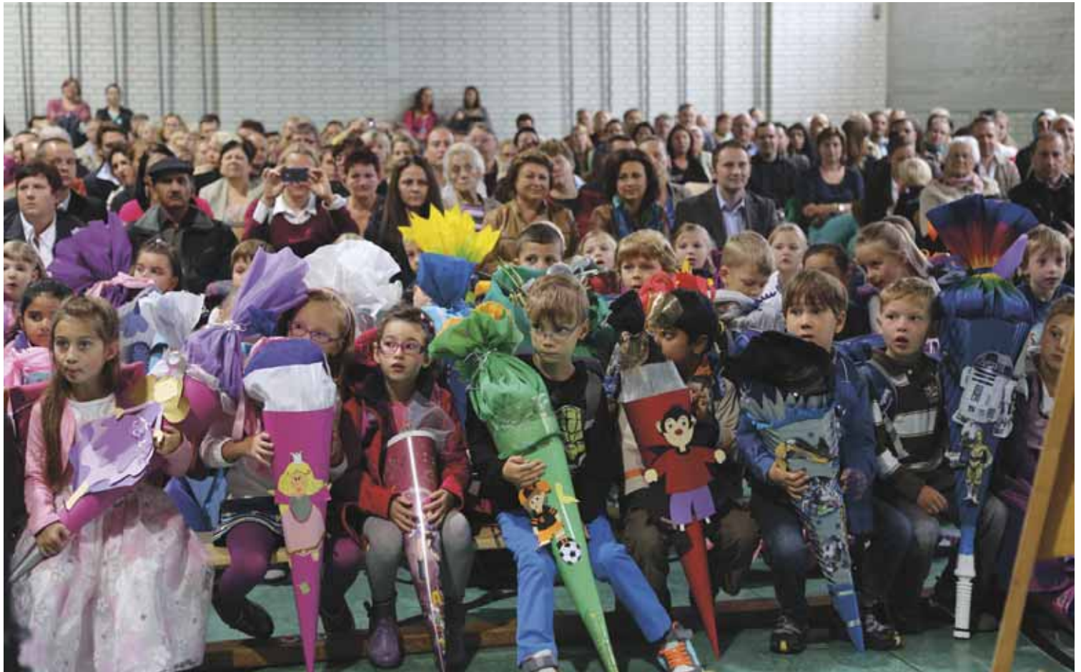
Die Erstklässler des Schuljahres 2013/14 bei der Begrüßung in der Turnhalle der Grund- und Mittelschule Eching.

Ein wichtiger Hinweis: Die Eheleute Gisela und Alois Westermeier werden in gewohnter Weise als Schulwegbegleiter für die Kinder da sein. Dennoch bat Herr Westermeier die Eltern der Schulanfänger, die erste Zeit ihre Kinder auf dem Schulweg zu begleiten.