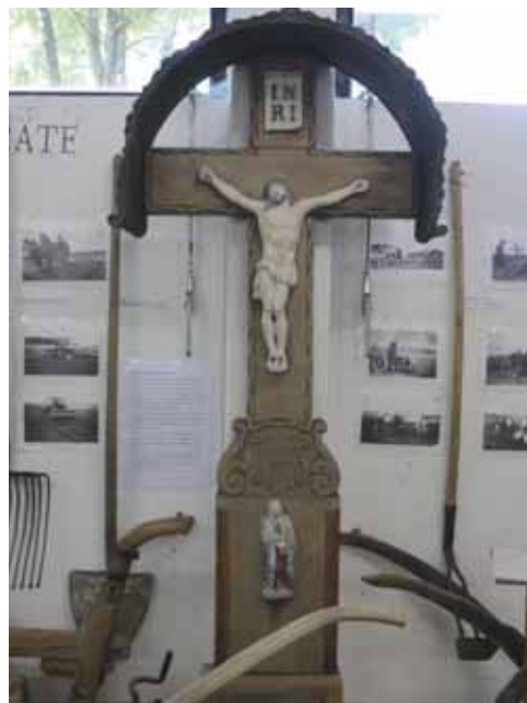
Das "Pfarrerfanny-Kreuz" wechselte mehrmals den Standort, bis es im Museum unter der Schulturmhalle eine dauerhafte und gute Bleibe fand.