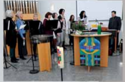
„Der 11er“ feierte sein 11tes