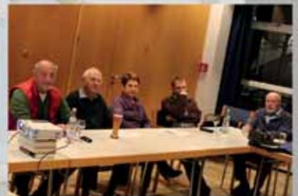
Hauptversammlung beim „Echinger Forum“