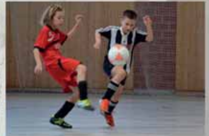
Hallenturniere der Nachwuchskicker