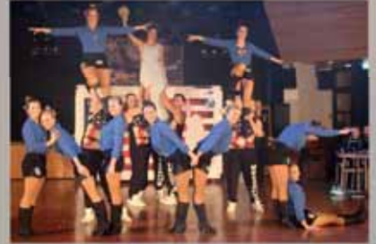
Faaasching: Der Endspurt!