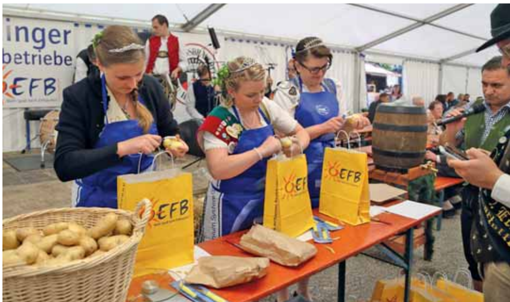
Die königlichen Hoheiten bei der Kartoffelolympiade.