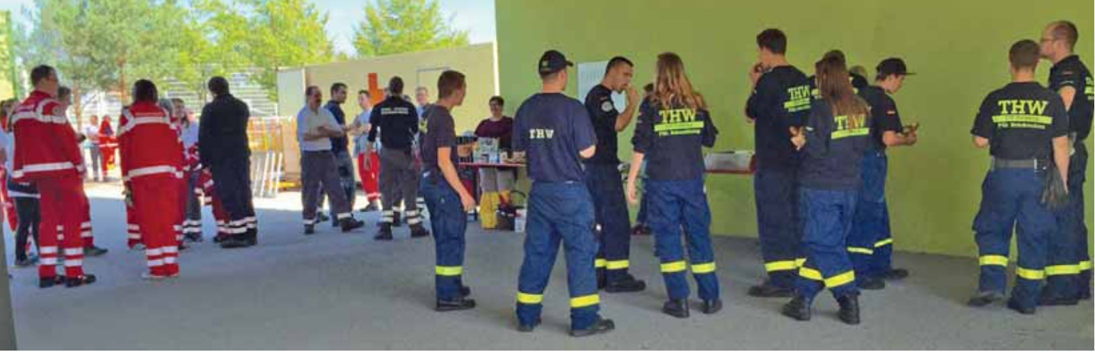
Die freiwilligen Helfer von THW, BRK und Wasserwacht waren hervorragend organisiert.