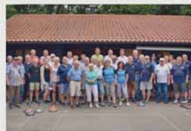
Großes Stockturnier zu „Urlaub dahoam“