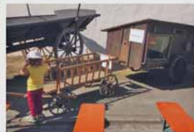
„Waagen und Wagen“ beim Waaghäuslfest