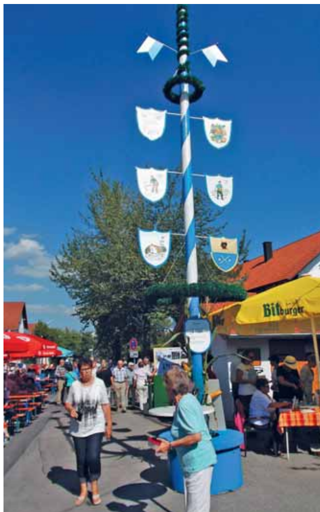
Der neue Maibaum fürs Waaghäusl.