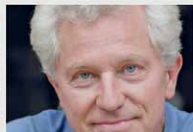
Bürgerhausprogramm startet wieder