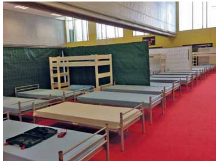
So sieht die Situation für die Asylsuchenden in der Turnhalle aus.

Am darauffolgenden Samstag wurde durch das THW Freising, das BRK (landkreisübergreifend) und die Wasserwacht die Turnhalle mit Betten und Tischen