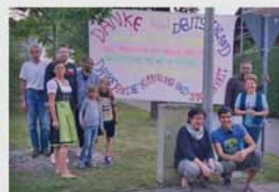
Alle Informationen zur Flüchtlingssituation