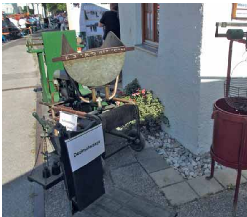
Schüsselwaage für Kartoffeln, Dezimalwaage und Stärkewaage für den Schnaps.