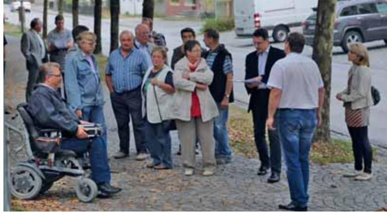
Reges Interesse herrschte bei den Bürger/-innen zum Thema Rathausumbau.

Wir weisen ausdrücklich darauf hin, dass in die Berichterstattung der Parteien nicht redaktionell eingegriffen wird, und die Artikel ausschließlich die Meinung des Verfassers, resp. seiner Fraktion, wiedergeben. Antworten richten Sie bitte direkt an die Verfasser.