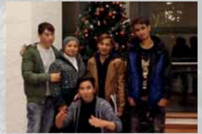
Bunte „Begegnung im Advent“