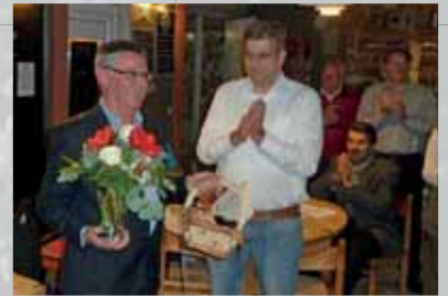
Führungswechsel beim SCE