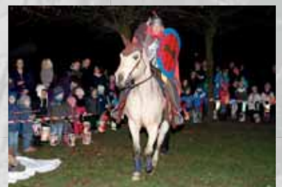
...meine Laterne mit mir: Alle St. Martins-Umzüge