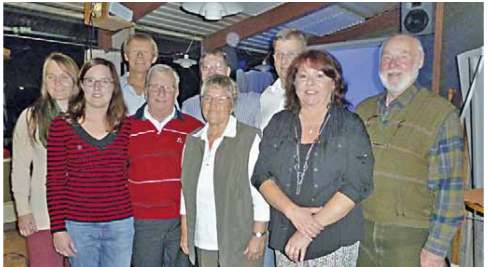
Der neue Vorstand des SCE.