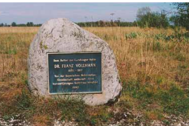
Gedenkstein für Dr. Franz Vollmann in der Garchingener Heide, errichtet im Dezember 1990.

Im Herbst stehen die Weißdornbäume und -büsche am Ostrand der Haide in flammendem Rot.