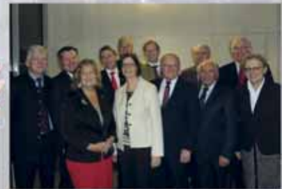
25 Jahre Heideflächenverein