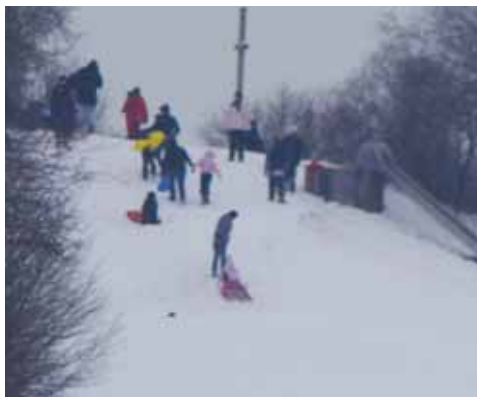
Echinger Schlittenberg