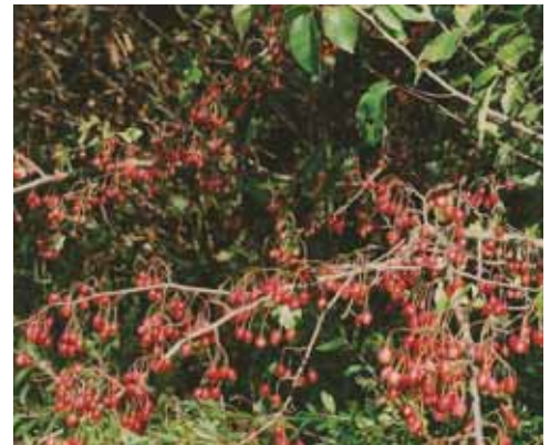
Bereenstrauch in der Heide (W. Buchmeier)