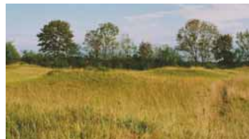
Garchinger Heide (W. Buchmeier)

Die 25-Jahr-Feier war nicht nur ein Jubiläum, sondern auch eine Würdigung der Frauen und Männer, die sich um den Umweltschutz und Erhalt der letzten großen Heideflächen in Bayern verdient gemacht haben.