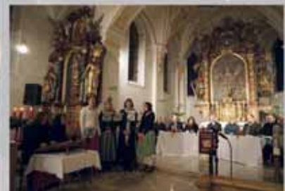
Nachlese: Advent und Weihnachtsfeiern