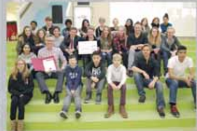
Auszeichnung für die Realschule