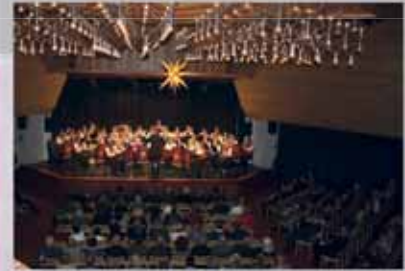
Neujahrsempfang zum Start von 2016