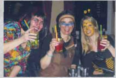
Faaasching...! Die Nachlese