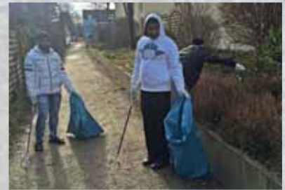
Ramadama durch die Asylbewerber