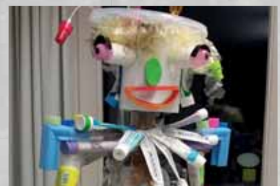
Geht's auch ohne Plastik?