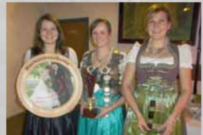
Schützenköniginnen der Weinbergsschützen