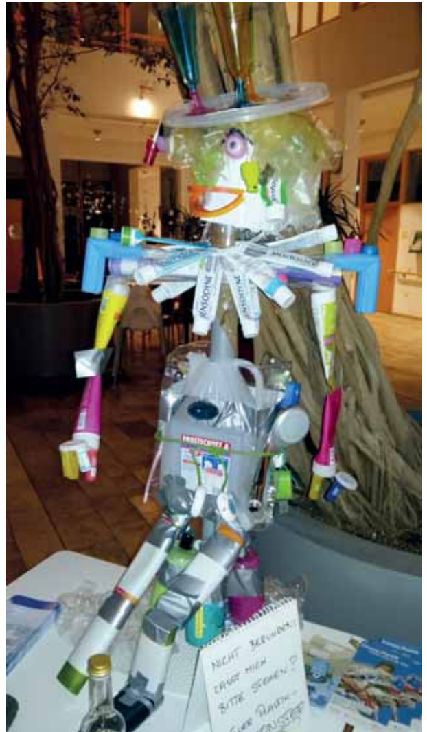
Badezimmermüll kreativ: Das Plastikmonster.