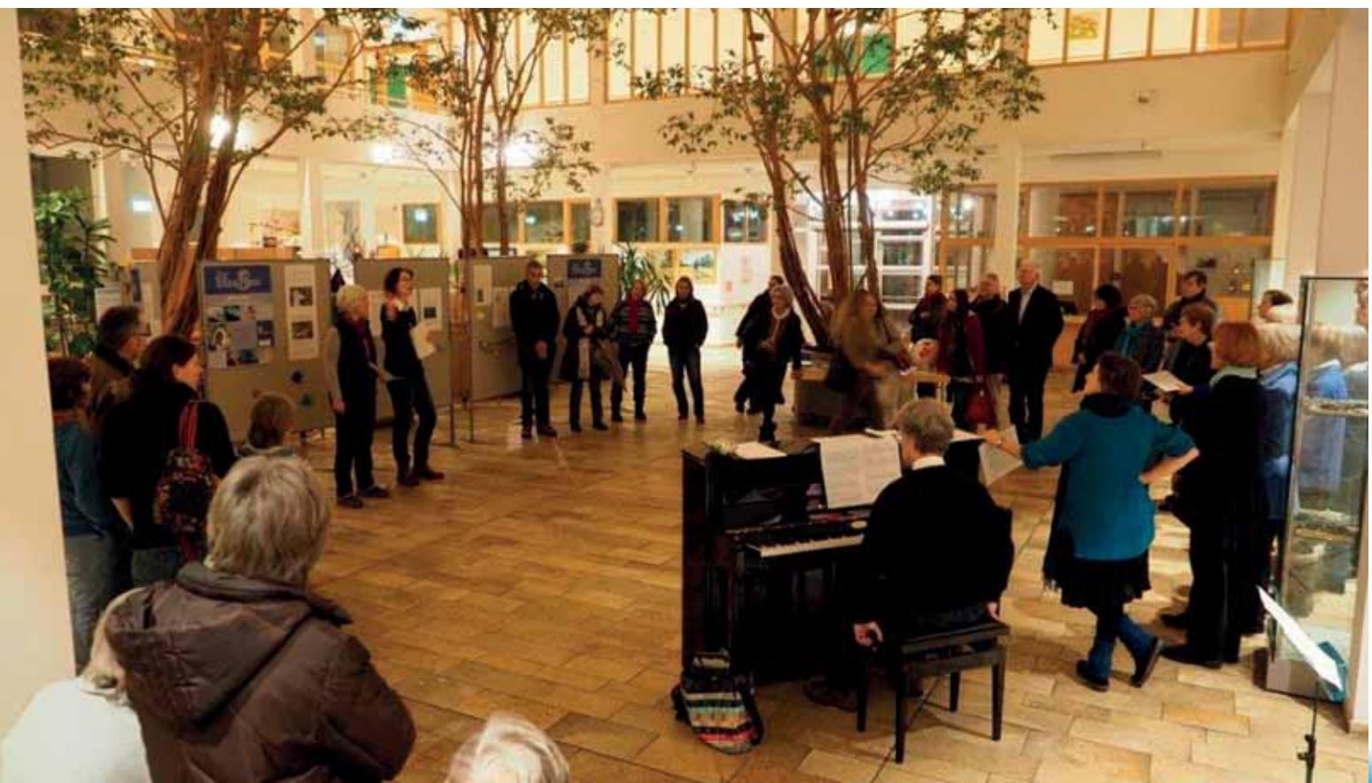
Aktionstag "Ohne Plastik" im ASZ.