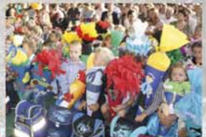
Auf geht's mit der Schule!