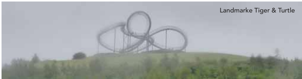
Landmarke Tiger & Turtle