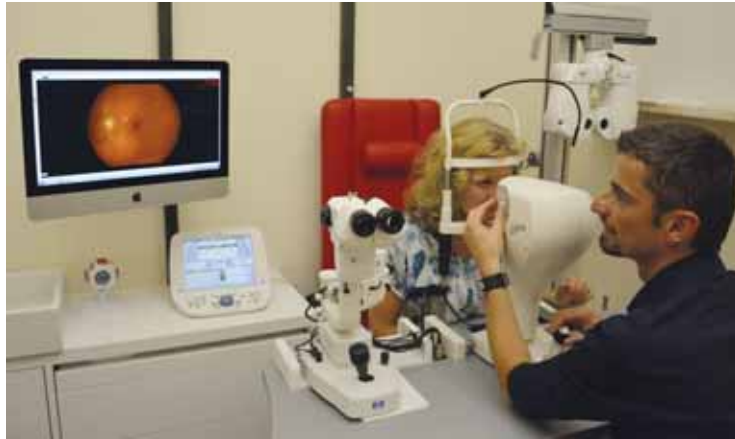
Mikroskopische Analyse des Augenhintergrundes

Neben einer sehr viel präziseren Sehstärken- und Augenoberflächenmessung bieten die Messgeräte von niki Optik erstmals die Möglichkeit der Früherkennung von Augenerkrankungen beim sogenannten Screening.