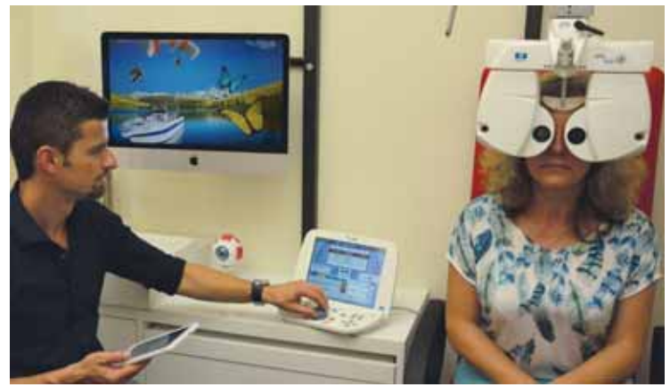
3D- Sehstärkenmessung, unterstützt durch natürliche Seheindrücke

Die videounterstützte Mikroskopie gewährt Ihnen zudem selbst Einblicke in die eigenen Augen. Am Bildschirm kann niki Optik bereits erstelltes Bildmaterial Ihrer Augen mit neuem vergleichen und Ihnen erklären worauf Sie