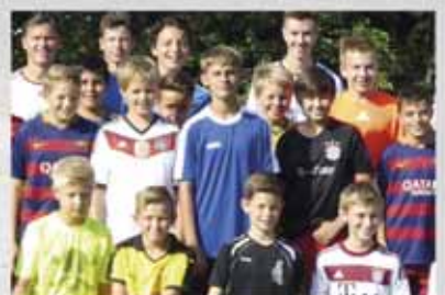
Trainingscamp und Start für die ‚Zebras‘