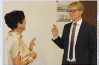
Der neue Bürgermeister ist im Amt