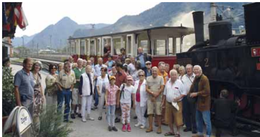
Echinger Forum 09/2016

In ca. 1.5 Stunden schnaufte der kleine Zug die steile Strecke hinauf am Waldrand. An einigen Stellen kreuzte er Wanderwege und teilweise hätte man vom Zug aus Blumen pflücken können.