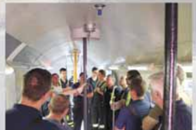
Spezialübung der Feuerwehren