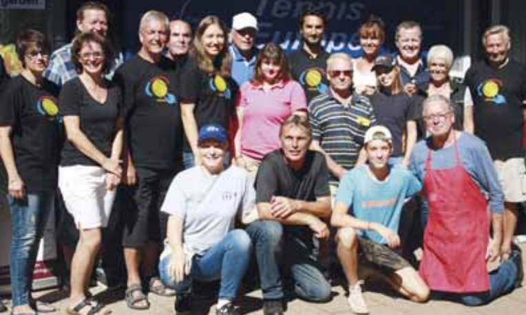
Das Organisations- und Betreuerteam.

und bezwang die Tschechin Klara Novakova nach ähnlich langer Matchdauer mit 7-6(6), 4-6, 6-3.