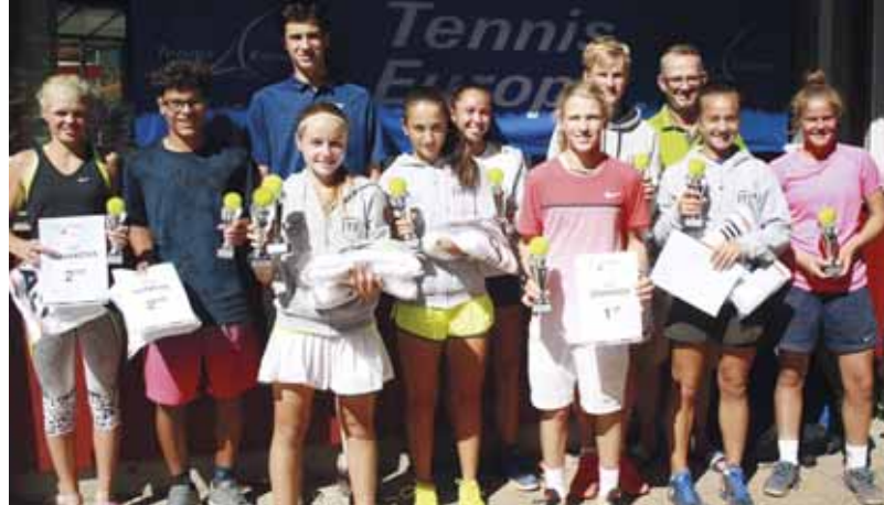
Die Sieger der einzelnen Bewerbe.

Etwas internationale Luft konnten die Teilnehmer der U9, U10 und U12 am Finalwochenende schnuppern, als sie ihre Matches neben denen „der Großen“ austrugen.