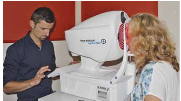
Ermittlung von Augeninnendruck, Tag- und Nachtsehen, Vermessung der Hornhautoberfläche

Machen Sie sich selbst ein Bild! Im Rahmen der weltweiten „Woche des Sehens“ vom 8. bis 15. Oktober 2016 lädt niki Optik Sie dazu ein vorbeizuschauen und einen Blick auf und durch die vielen neuen Messgeräte des High Tech Messraums von niki Optik zu werfen. Außerdem gibt es den ganzen Oktober den Computer-Schnelltest gratis!