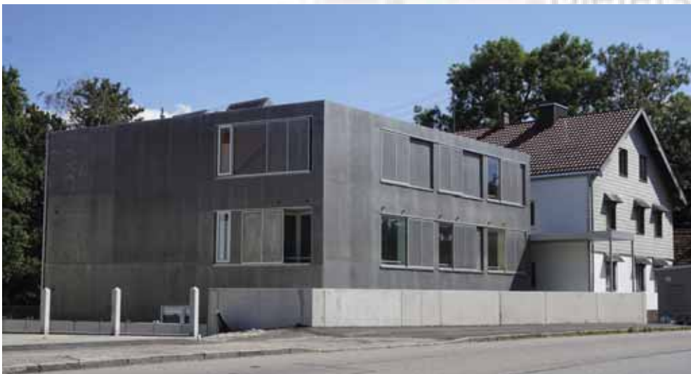
Ein Hingucker an der ehemaligen B11 in Dietersheim ist das eben fertig gestellte Haus auf dem Mayer-Grund- stück. Hier sind 10 moderne Studentenwohnungen ent- standen, die für das nahe Forschungszentrum Garching sehr wichtig sind.