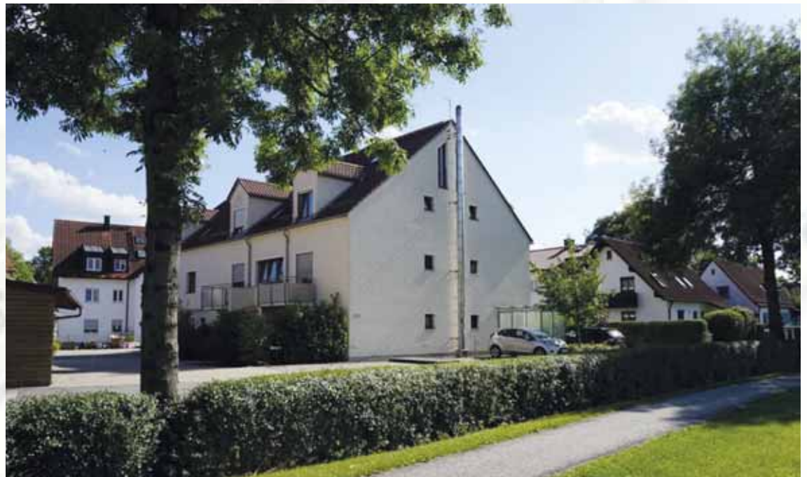
An der Langen Gasse entstand 2012 im Maurus-Hof auf dem Hofanger ein größeres Mietshaus. (Texte/Bilder Dietersheim: Irene Nadler)