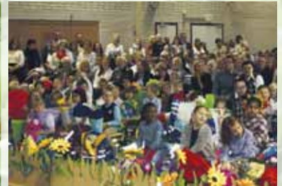
Der erste Schultag