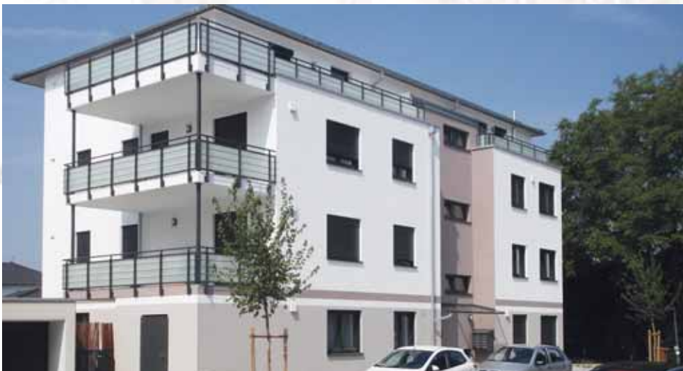
Im Norden der Bahnhofstraße.