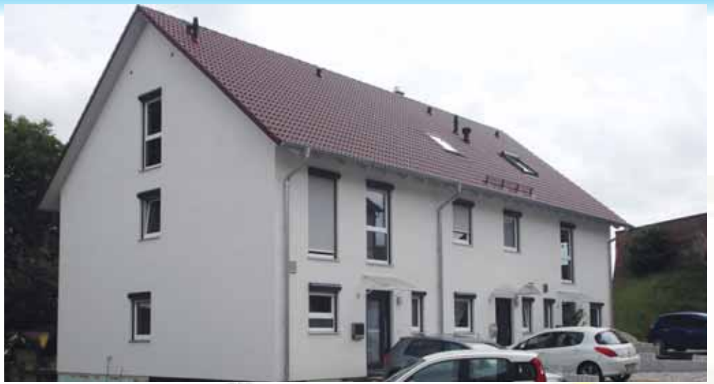
An der Kirchstraße in Günzenhausen, unterhalb der Kirche.