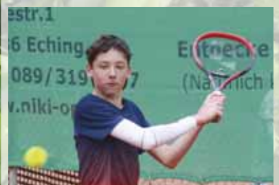
Bayerns größtes Tennisturnier