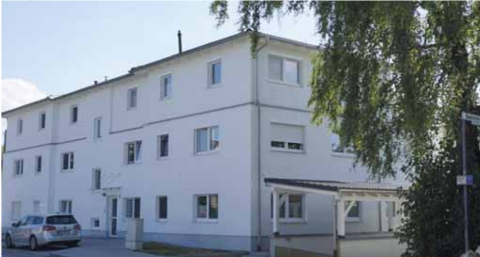
An der nördlichen Einfahrt nach Dietersheim steht auf dem ehemaligen Jägermeyr-Hof ein großes Mehrfamili- enhaus mit Eigentumswohnungen.