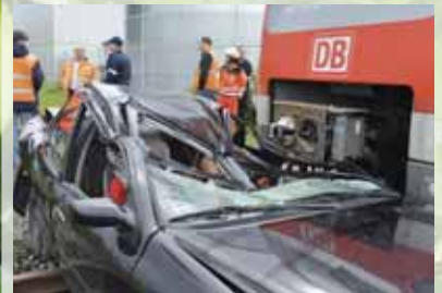
Große Übung für den Ernstfall