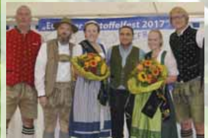
Kartoffelfest der EFB