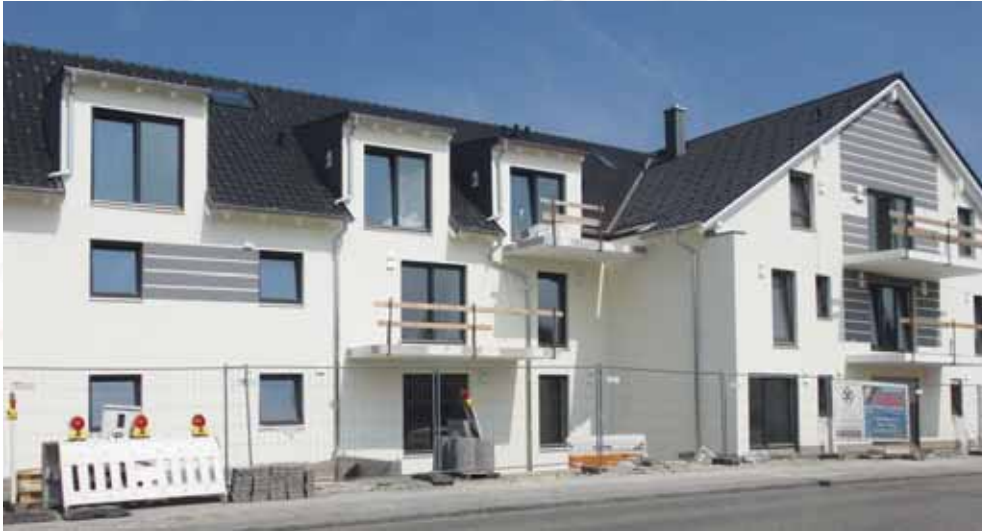
An der Oberen Hauptstraße in Eching.

Das "Echinger Forum" wird wie seit 45 Jahren gewohnt auch diesen Wandel begleiten und dokumentieren. Vor dem Baubeginn der Neubaugebiete sehen Sie heute einen Streifzug durch die Entwicklungen der letzten Monate in Eching, Dietersheim und Günzenhausen - absolut ohne Anspruch auf Vollständigkeit und in zufälliger Auswahl!