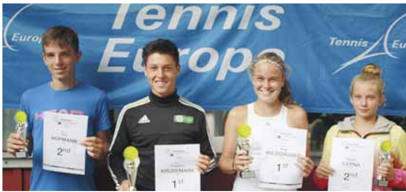
Die Teilnehmer der Endspiele U16 bei den Bavarian Open.

Das Hauptfeld startete mit über 200 Spielern, die aus über 30 verschiedenen Ländern anreisen. Dabei waren Australien und Südafrika stark vertreten. Weite Anreisen hatten auch Teilnehmer aus Thailand, Indien, USA, Südamerika oder der Mongolei. Auch aus fast jedem Europäischem Land kam mindestens ein Teilnehmer.