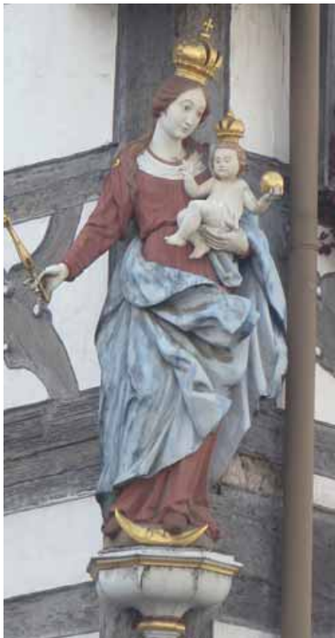
Echinger Forum 09/2017

Niederschlagsmenge/Monat August: 145 ltr.