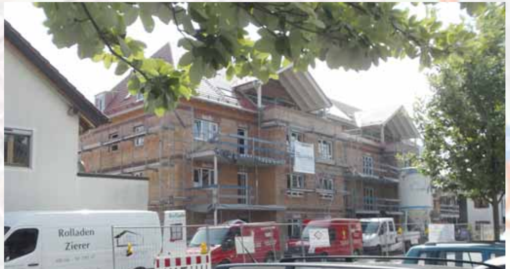
An der Bahnhofstraße, gegenüber von Papierwaren Diegel"