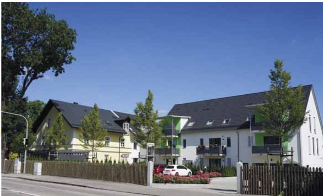
Auf dem Enzensberger Grundstück an der ehemaligen B11 in Dietersheim wurde der Bauernhof mit Viehwirtschaft aufgegeben und ebenfalls Mietwohnungen in verschiedenen Größen gebaut.