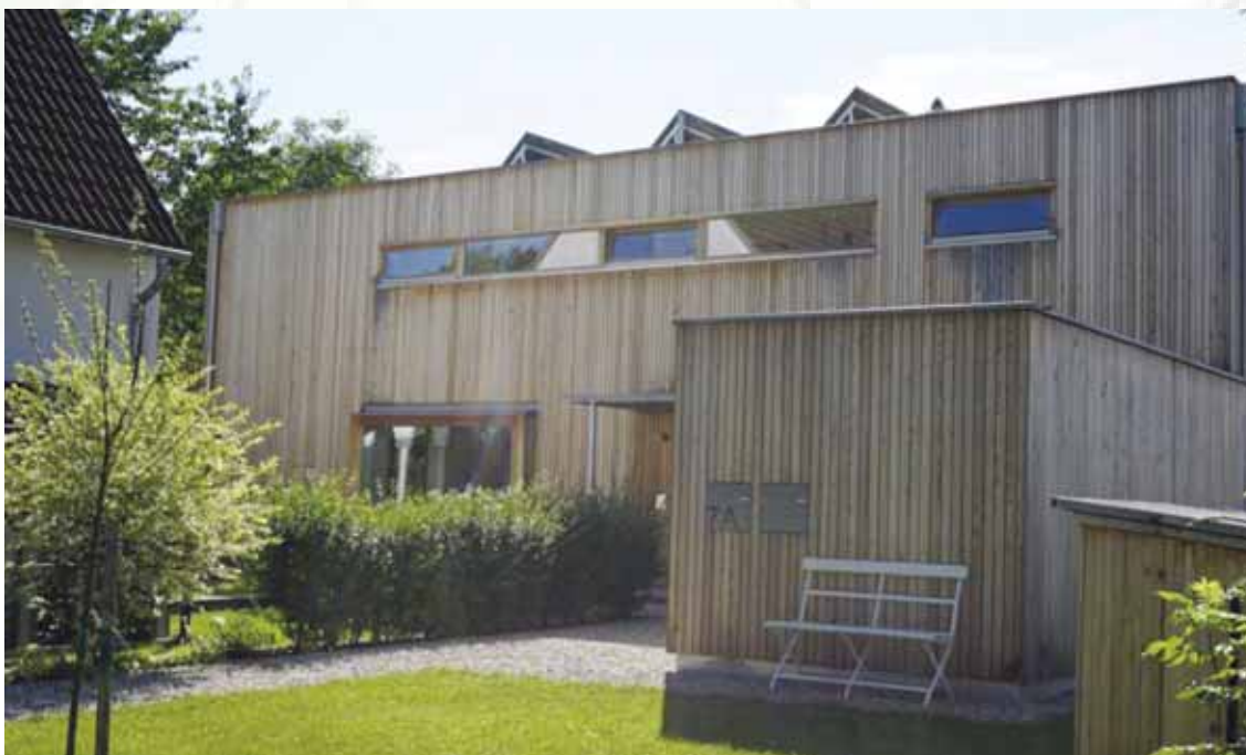
Auf den relativ großen Grundstücken, die früher nur mit kleinen Einfamilienhäusern bebaut waren, sind in Dietersheim neben konventionellen Häusern auch viele interessante Hausbauten des Büros Wagner & Partner (ehemals "Büro 4") entstanden, die immer wieder bei den alljährlichen "Architektouren" der Architektenkammer ausgezeichnet wurden.