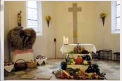
Erntedank in den Pfarreien