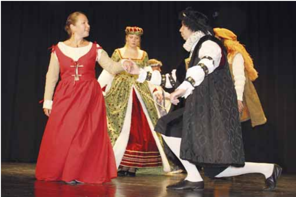
Mittelalterliche Tänze wurden beim Jubiläumsfest im Juli gezeigt.

Im Frühjahr hat die Gemeinde im Kirchgarten eine Apfelquitte gepflanzt. Damit wurde die Verbindung zu Wittenberg, dem Ort des Lutherschen Thesenanschlags 1517, hergestellt. 2011 hatte die damalige Pfarrerin Katrin Weidemann als 87. Baum im damals begonnenen "Luthergarten" einen Rotdorn für die Echinger Gemeinde gepflanzt. Die Anpflanzung in der Magdalenenkirche ist nun das Gegenstück auf heimischem Boden.