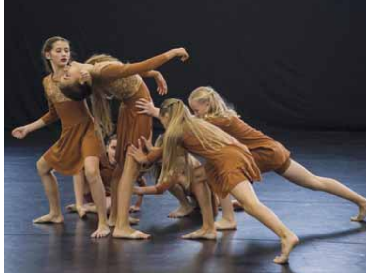
Die jungen Tänzerinnen von „New Elements“.

Das Prinzenpaar der "Heidechia" 2017/18 - leicht verfremdet...