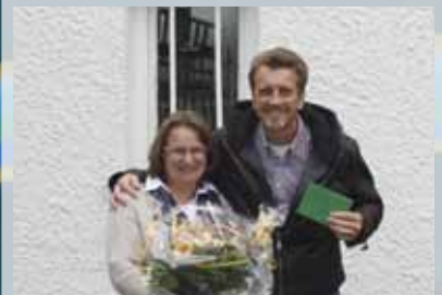
1000 Mitglied im Siedlerverein