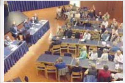
Bürgerversammlungen für 2017