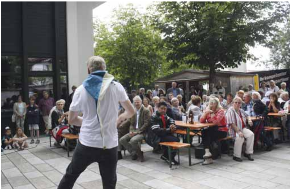
Ein großer Feiertag war das ökumenische Fest auf dem Bürgerplatz.