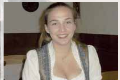
Herausragende Schützin mit 16