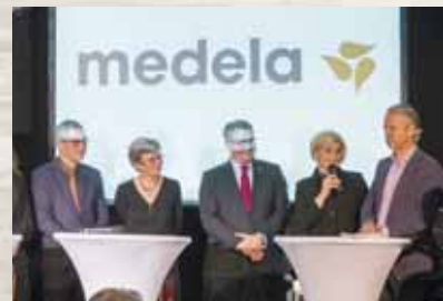
Jubiläum von Medela Deutschland