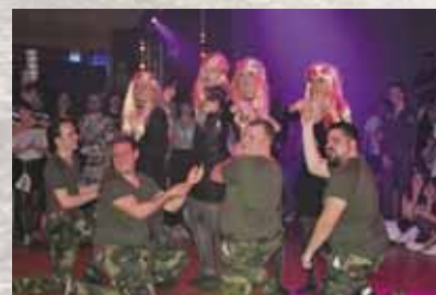
Faasching...! Rückschau auf tolle Tage