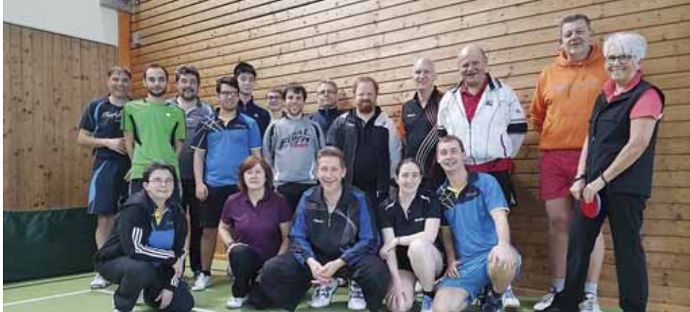
Die Teilnehmer der Erwachsenen-Vereinsmeisterschaft 2018.