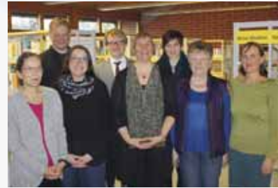
Ehrungen in der Gemeindebücherei