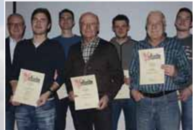
Hauptversammlung beim TSV