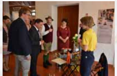
Frühjahrsschau der Echinger Fachbetriebe