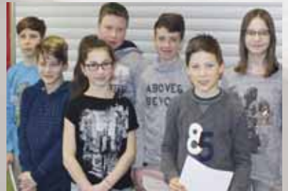
Engagiert für die Mitschüler