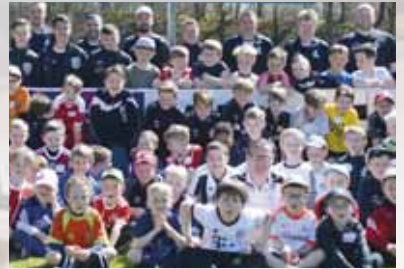
Ostercamp für die Kids beim TSV