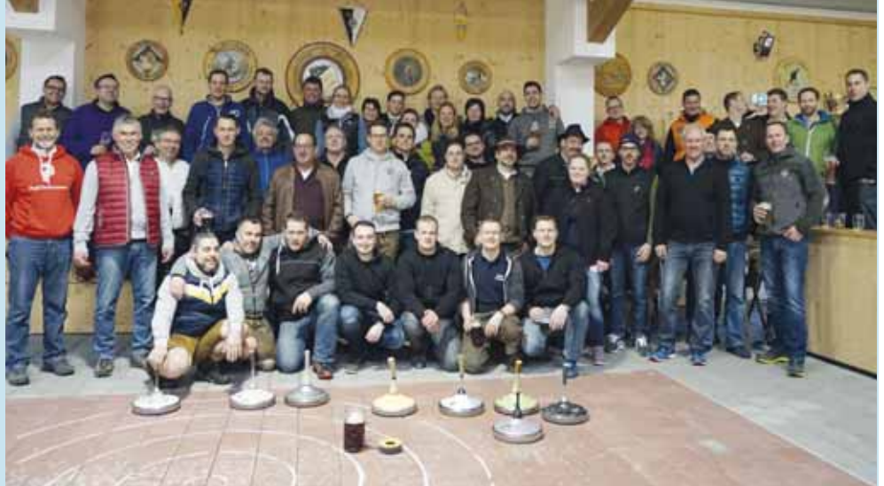
Man sieht es, allen Stockschützen hat es großen Spaß gemacht, in der großzügigen Halle beim diesjährigen Stockturnier der Dietersheimer Gruppierungen teilzunehmen.

Das 47. Gauschützenfest beginnt am Freitag, 1. Juni, um 17 Uhr mit einem Standkonzert am Maibaum und dem Einzug in die Festhalle mit der Allershausener Blasmusik. Ab 20 Uhr wird die fetzige „Nacht der Schützen“ mit der Party-Band "High Fly" gefeiert. Am Samstag geht es etwas ruhiger zu. Um 18 Uhr ist Einlass in die