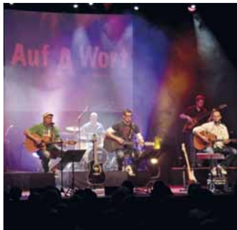
"Auf a Wort" - Sie spielen die Hits der Austropop-Größen.

Mit Ihrem Besuch unseres Benefiz-Konzertes leisten Sie auch gleichzeitig einen Beitrag für die Spende an das Kinderhospiz München, getreu nach deren Motto: Nicht das Leben mit Tagen, sondern die Tage mit Leben füllen, denn der Erlös des Abends wird durch unser Lions-Hilfswerk Eching e.V. der Stiftung Ambulantes Kinderhospiz München zu Gute kommen. Seit 2005 wird durch diese Einrichtung Familien mit unheilbar kranken und lebensbedrohlich erkrankten Ungeborenen, Neugeborenen, Kindern und Jugendlichen sowie jungen Erwachsenen in München und ganz Bayern geholfen. Ziel ist es, den Familien in dieser schwierigen Zeit eine feste Stütze zu sein und Momente der Sicherheit, Geborgenheit und Normalität zu schenken.