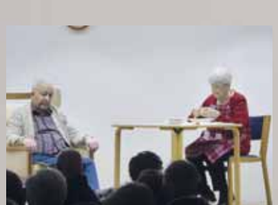
20 Jahre Theatergruppe im ASZ