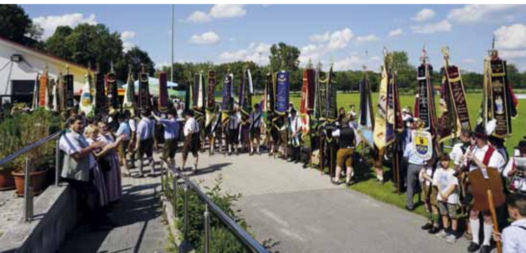
Fahnenparade vor dem Festzelt.