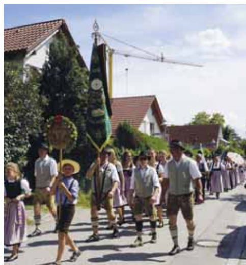
Der Festzug im Bartl-Mayer-Weg.

Irene Nadler/ Krachende Böller weckten am Sonntag, dem 3. Juni, um 6 Uhr viele Dietersheimer auf. Das war der Startschuss zum 47. Gauschützenfest. Alles war ab 8 Uhr früh für den Empfang der Vereine, die am Gauschießen teilgenommen hatten, von der Schützengesellschaft „Die Gemütlichen“ Dietersheim e.V. perfekt hergerichtet.