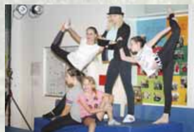
Bunter Abend der Realschule