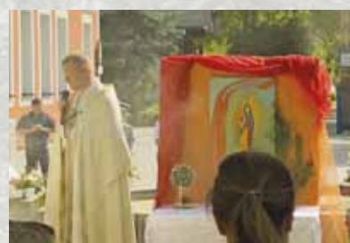
Prozession zu Fronleichnam