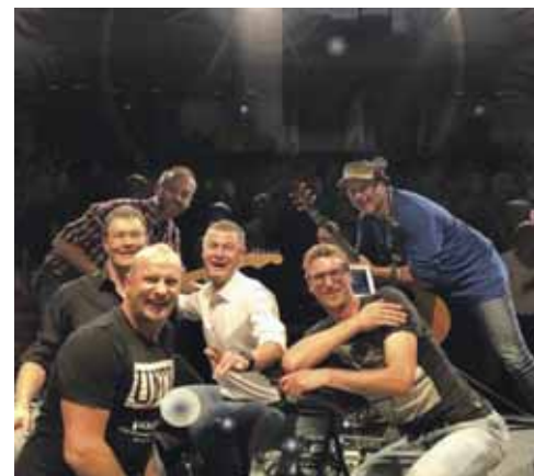
Unsere Benefiz-Band "AufAWort" im Bürgerhaus Echinger.

089/319 11 47 Walter Haschke Hausverwaltungen Echinger Uhländstr. 12 info@haschke.com