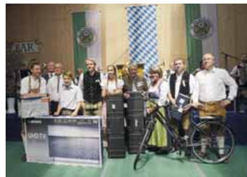
Die Sieger des Gauschießens in den verschiedenen Sparten mit ihren Preisen

Fähnenschwingen war dann auch in der Halle angesagt, wo mancher Fahnenträger mit akrobati-