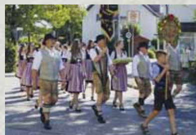
Gauschützenfest in Dietersheim