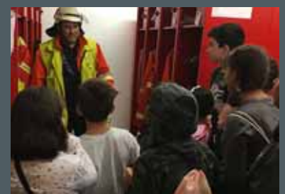
Integration mit der Feuerwehr