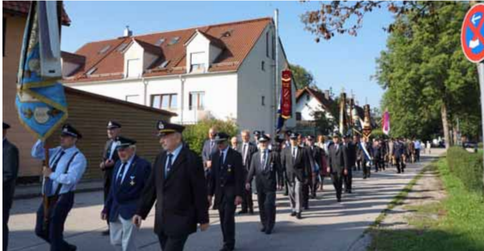
In einem festlichen Zug bewegten sich die Vereine die Lange Gasse entlang zum Lokal „Lokitos“. Im Vordergrund der Dietersheimer Krieger- u. Soldatenverein mit Fahne.

Irene Nadler/ In der Dietersheimer Chronik kann man es nachlesen, dass auch das kleine Dorf Dietersheim im 1. Weltkrieg einen großen Tribut für das Vaterland zollen musste. Von 46 Männern und Burschen, die Anfang August 1914 zum Militär eingezogen wurden, kamen nur 32 nach dem Krieg zurück.