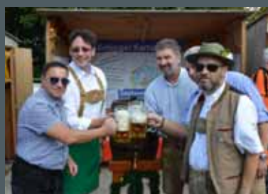
Kartoffelfest der Echinger Fachbetriebe