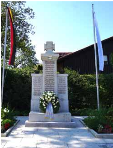
Das Kriegerdenkmal Dietersheim.