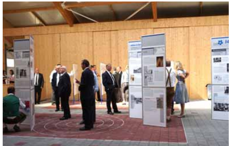
Der Volksbund Deutsche Kriegsgräberfürsorge zeigte eine Ausstellung über den Ersten Weltkrieg.