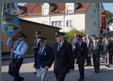
100 Jahre Kriegerverein in Dietersheim