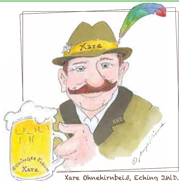
Xare Ohnehirnbeiß, Eching J.W.D.