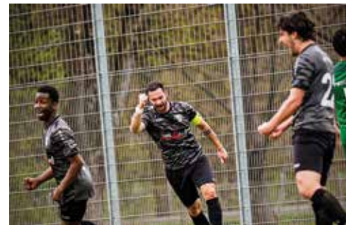
Im Spiel gegen den SC Freising Anfang April siegten die 1. Herren souverän mit 3:0.