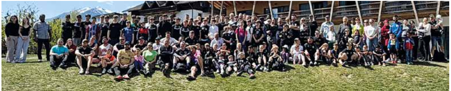
Spieler, Trainer, Eltern und Geschwister - insgesamt 185 TSVler beim alljährlichen Oster-Trainingslager in Natz.

Liebe Bürgerinnen und Bürger, am 19. Mai trat der neu gewählte Gemeinderat zu seiner konstituierenden Sitzung zusammen. In der nächsten Ausgabe werden Sie an dieser Stelle bereits erste Einblicke in die Arbeit des neuen Gremiums erhalten.